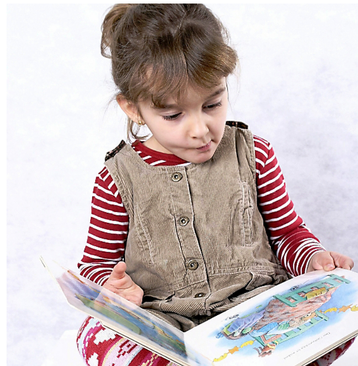
Kinder, die Bücher lieben, sind wacher und stabiler.

Kontakt Kindereinrichtungen, die sich für eine Bücherkiste anmelden möchten, können das bei Sonja Erdel unter Telefon 09361/860180 oder per E-Mail unter serdel@web.de tun.